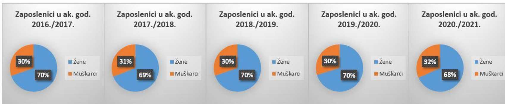
Slika 3. Prikaz omjera svih zaposlenika Učiteljskog fakulteta po spolu od akad. god. 2017./2018. do akad. god. 2020./2021.