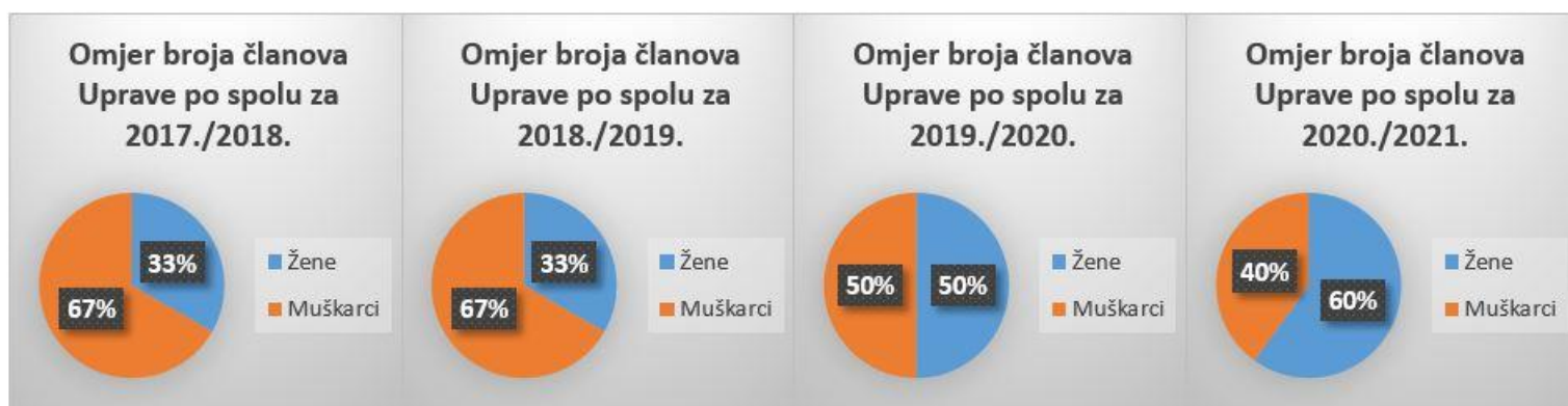
Slika 5. Prikaz omjera uprave Fakulteta po spolu od akad. god. 2017./2018. do akad. god. 2020./2021.